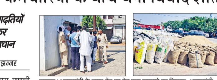
झज्जर। अनाजमंडी के मुख्य गेट पर गेट पास कटवाते हुए किसान, अनाजमंडी परिसर में रखी बाजरे से भरी बोरियां।

प्रशासनिक अधिकारी द्वारा हस्तक्षेप के बाद गेट पास कार्य सुचारू हो पाया। अब मंडी में कार्य सुचारू रूप से चल रहा है। बता दें कि आदतियों के अनुसार कई किसानों ने गेट पास लागू होने से पहले ही अपना बाजरा मंडी में डाल दिया था, लेकिन अब उनसे जबर्न गेट पास मांगा जा रहा था। इस प्रकार किसानों को नियमों के नाम पर परेशान किया जा रहा था। यदि समय पर गेट पास नहीं काटे जाते तो कई किसान भावनाएं भ्रष्टाचार योजना का लाभ लेने से वंचित रह जाते। उधर, प्राइवेट स्तर पर बाजरा खरीद कार्य तथा धान की आवक निरंतर जारी है। आदतियों द्वारा बोली लगाकर धान की खरीद की जा रही है।