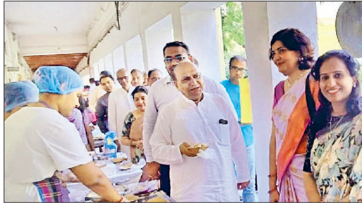
झज्जर। छात्राओं द्वारा लगाई गई स्टॉल्स का अवलोकन करते हुए मुख्यातिथि।