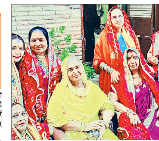
झज्जर। कथा सुनने के उपरांत बुजुर्गों का आशीर्वाद लेती महिलाएं।

के अनुसार माताओं द्वारा तारों को अर्घ्य देते समय यह भी कहा जाता है कि जिस प्रकार आसमान में तारें खिले हैं उसी प्रकार उनका परिवार भी संतानों से भरा रहे। पहले दीवारों पर चित्रकारी से बनाई जाती थी अहोई माता पिछले करीब पचास वर्षों से अहोई अष्टमी के व्रत करती आ रहीं शांदा देवी व बसंती देवी ने