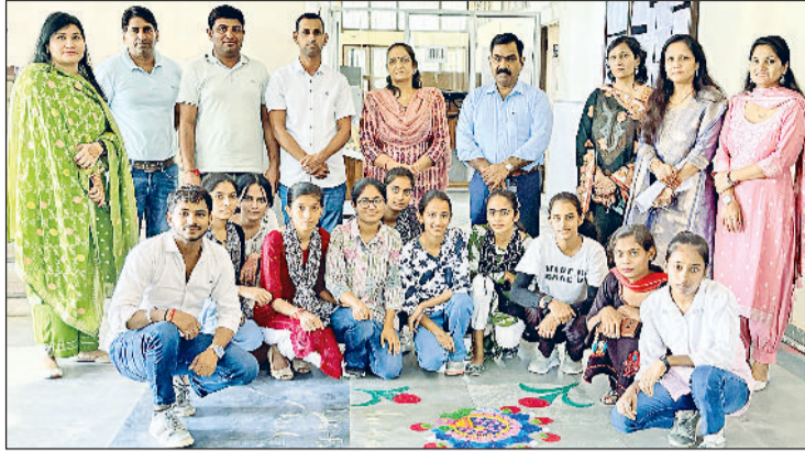
झज्जर। शिक्षकों के साथ उपस्थित रंगोली प्रतियोगिता के विद्यार्थी।