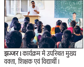
झज्जर। कार्यक्रम में उपस्थित मुख्य वक्ता, शिक्षक एवं विद्यार्थी।