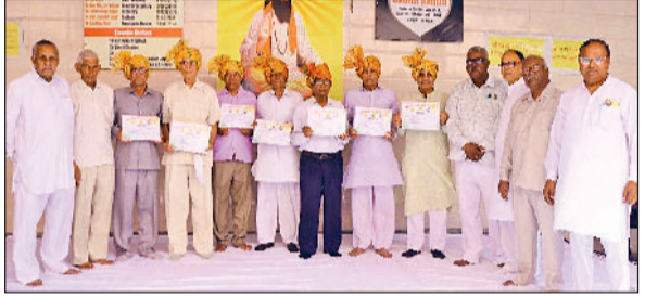
बहादुरगढ़। पदाधिकारियों के साथ सम्मानित दान देने वाले लोग।